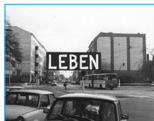
Geld oder Leben